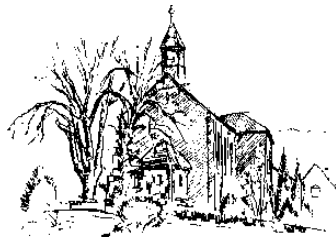
St. Franz von Sales, Kandern

Ihr Christen habt in eurer Obhut ein Dokument mit genug Dynamit in sich, die gesamte Zivilisation in Stücke zu blasen, die Welt auf den Kopf zu stellen, dieser kriegszerrissenen Welt Frieden zu bringen.